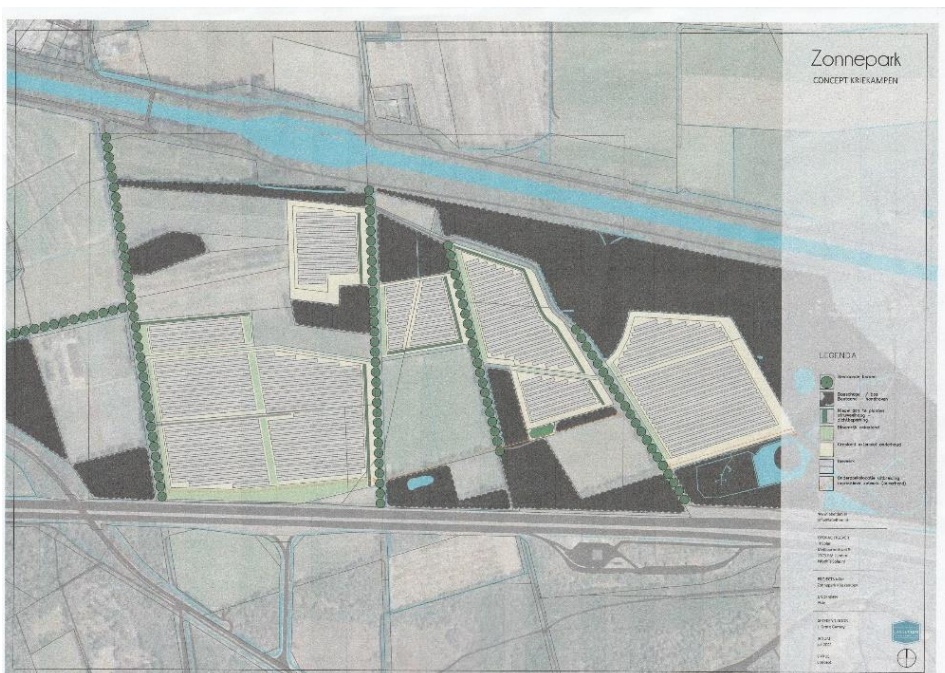
Voorstel zonnepark Kriekampen

Specifiek voor zonnepark Kriekampen heeft de SBEO met BdK, IVN en WN&L een voorstel voor boscompensatie en verbetering van de ecologische zone aangeleverd.