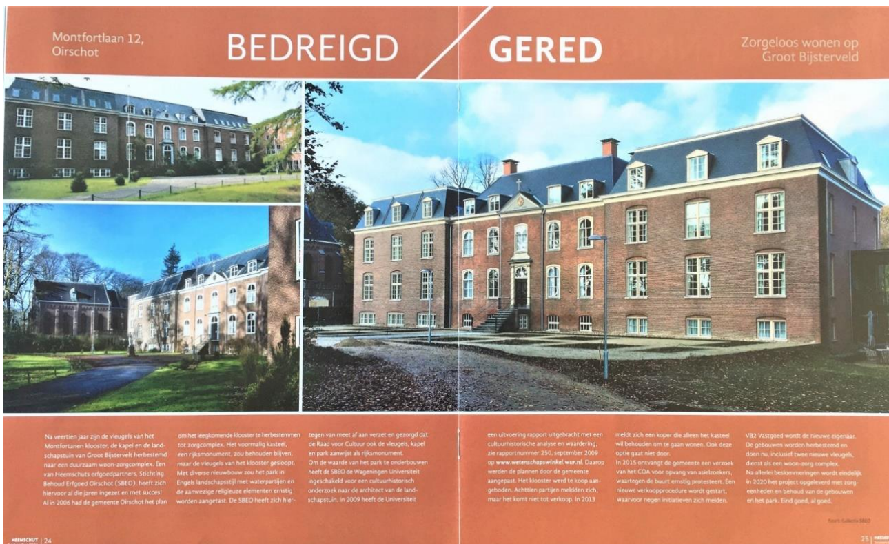
Heemschut, kwartaaluitgave september 2021, artikel Groot Bijsterveld.